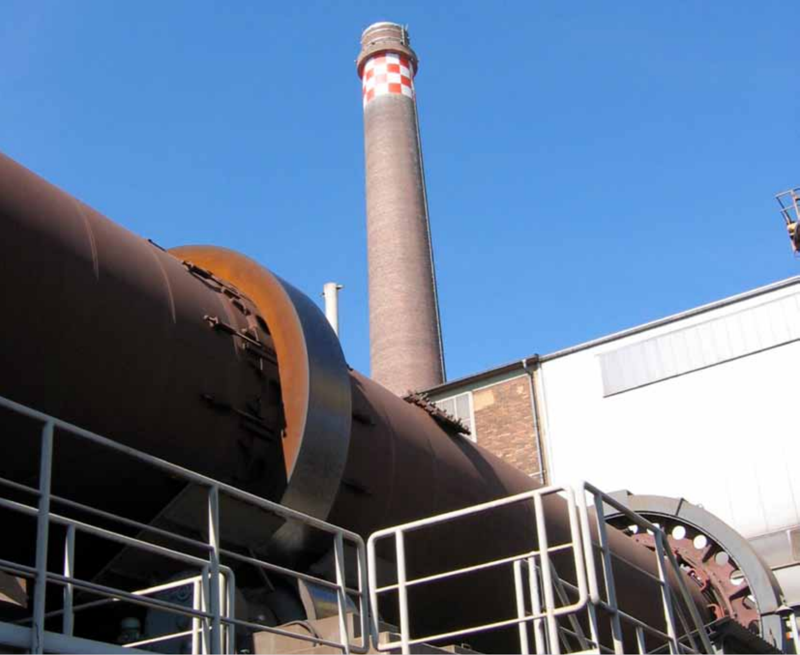
Vista lateral del horno Waelz de Befesa Zinc Freiberg (Alemania)