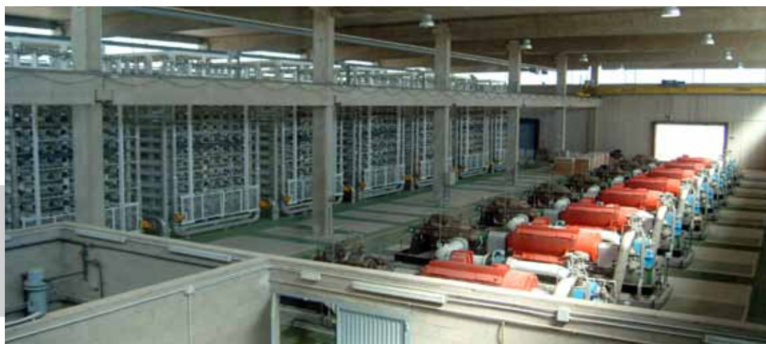
Vista interior de una planta desaladora en Almería (España)