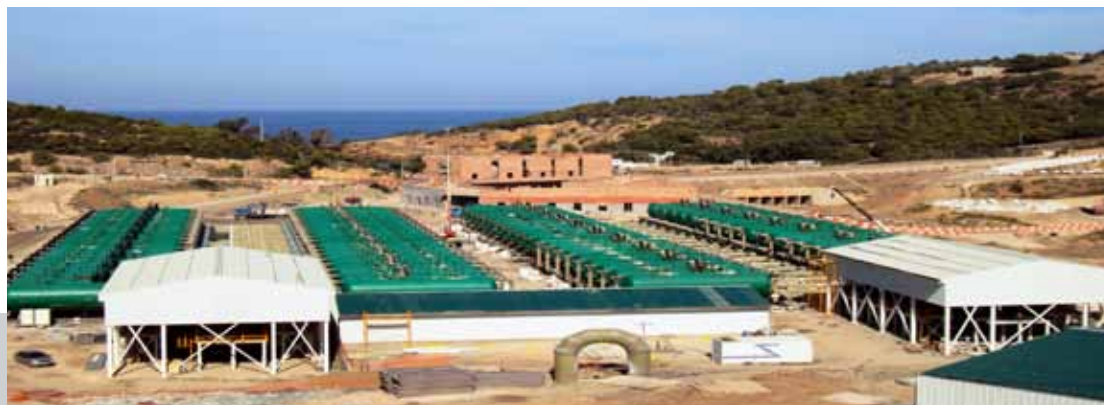
Vista exterior de la planta desaladora en Honaine (Argelia)